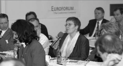
Die Teilnehmer im Gedankenaustausch mit den Referenten.