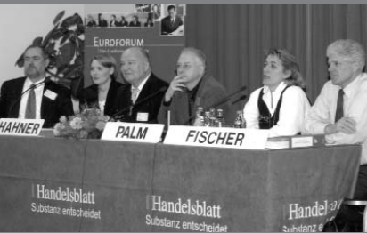
Angeregte Diskussionen mit dem Auditorium.